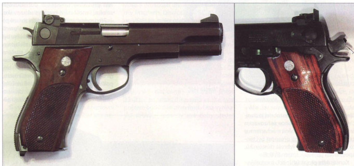
◀ Smith & Wesson M52-2