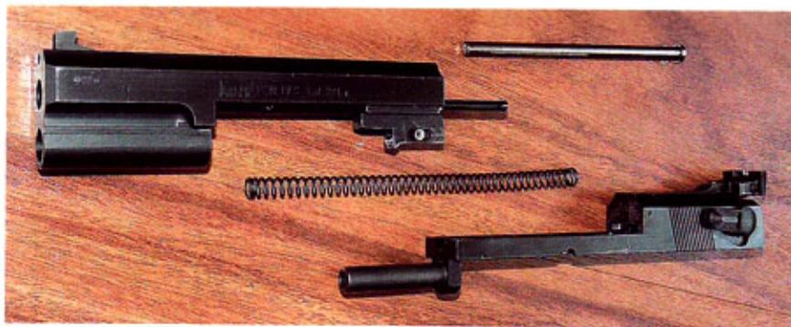
◀ Malorážkový adaptér Peters Stahl (do soupravy patří ještě zásobník)

S vývojem nových disciplín sportovní střelby, úpravou jejich pravidel a v ne-