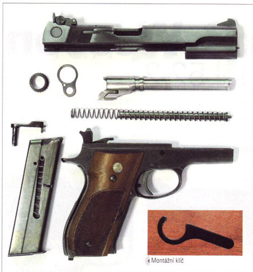
← Montážní klíč

hledím. Příznačný pro tento model je dvojitý mechanismus s lehce seřizovacím šroubem, kterým lze zaměnit mechanismus za jednočinný. Pro svoji přesnost byl tento model zařazen do výbroje důstojníků, speciálních jednotek a námořnictva.